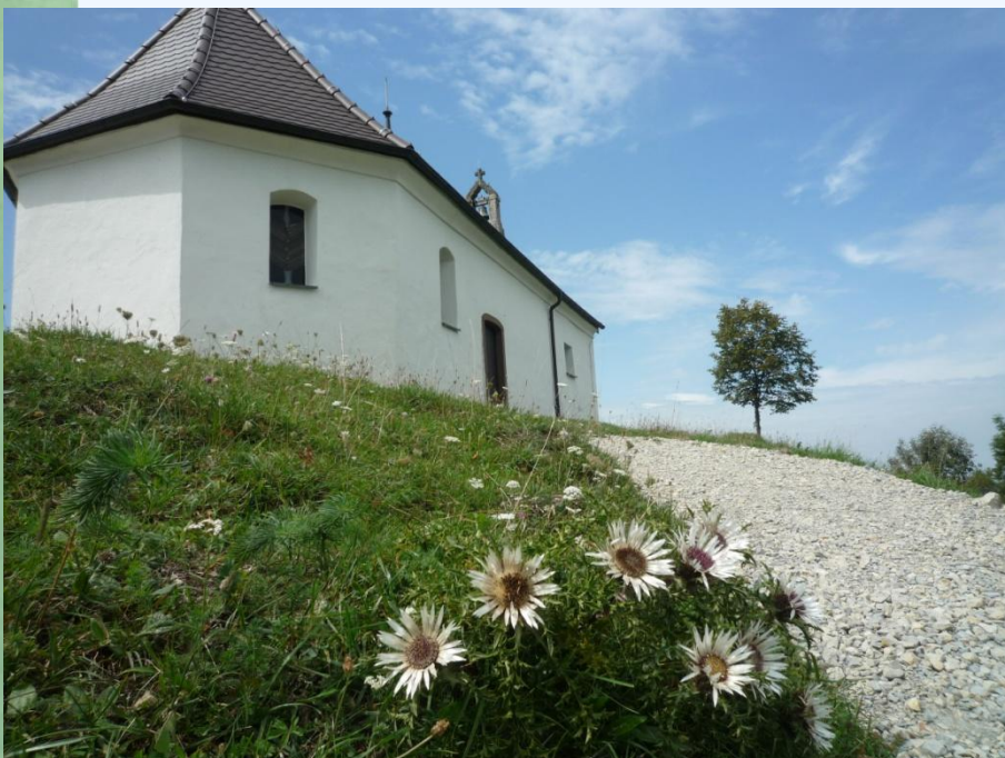
Foto: Silberdisteln bei der SalmendingerKapelle